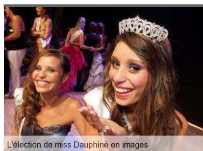
L'élection de miss Dauphiné en images